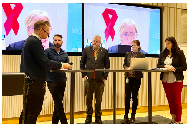
Panelsamtal med regionpolitiker i Västra Götalandsregionen vid seminariet Hiv på agendan – livskvalitet och nya målsättningar .