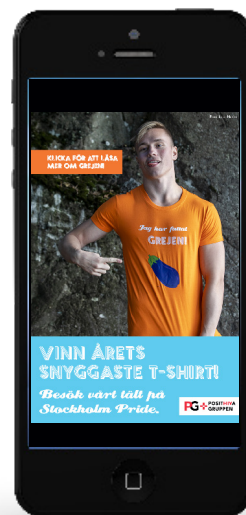
Annonser som visades på Grindr i samband med Stockholm Pride.

Under året annonserade PG i QX Magazine, på qx.se och på cruiser.se.