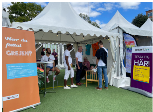
Preventivhs tält på Stockholm Pride där besökare kunde testa sig för hiv och syfilis samt få svar på frågor om hiv och att leva med hiv.

Representanter för PG finns med i nätverket HIV prevention in Nordic countries och deltog under 2022 i regelbundna möten. Nätverket samlar aktörer som arbetar med hiv och hivprevention i de nordiska länderna för kunskapsutbyte. I nätverket ingår bland andra Hiv Norge, Helseutvalget i Norge, Positivisiet (Hiv Finland), Aidsfondet i Danmark, olika RFSL-föreningar och Noaks Ark och nätverket är startat på initiativ av Hivpoint i Finland.