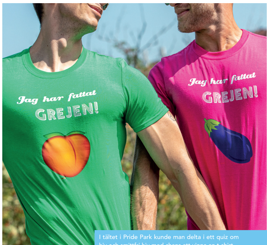
I tältet i Pride Park kunde man delta i ett quiz om hiv och smittfri hiv med chans att vinna en t-shirt.

Jag har fattat grejen! inleddes våren 2019 med